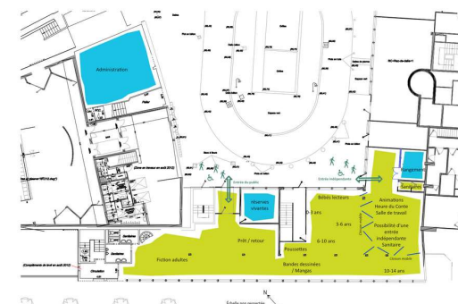
PREMIER ACTE PROGRAMMATION Étude de faisabilité, de programmation et d'assistance à maîtrise d'ouvrage pour aménagement d'une médiathèque et d'un service d'archives Ville de VANVES Scénario 5